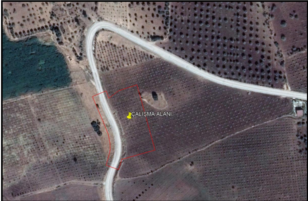
Şekil -2: Uydu Görüntüsü-2

Aşağıda alanın en güncel yapılaşma durumunu gösteren uydu görüntüsü verilmiştir. Çalışma alanında herhangi bir yapılaşma bulunmamaktadır. Uydu görüntüsünden görüldüğü üzere alanın batı cephesinden yol geçmektedir bu yol planda da kullanılmıştır.