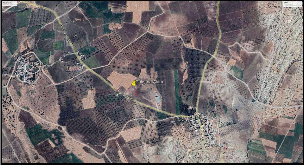
Şekil -1: Uydu Görüntüsü-1

Çalışma Alanı, Kilis ili Musabeyli ilçe Karbeyaz Köyü 132 Ada 1 Parsel O37-B-15-D 1/5000 ölçekli Nazım İmar paftalarında yer almakta olup, yaklaşık 0,5 hektarlık alanı kaplamaktadır. Alan, planlanan Kilis – Musabeyli yolu kenarında yer almaktadır. Aşağıda alanın konumu ve yapılaşma durumunu gösteren güncel uydu görüntüsü verilmiştir.