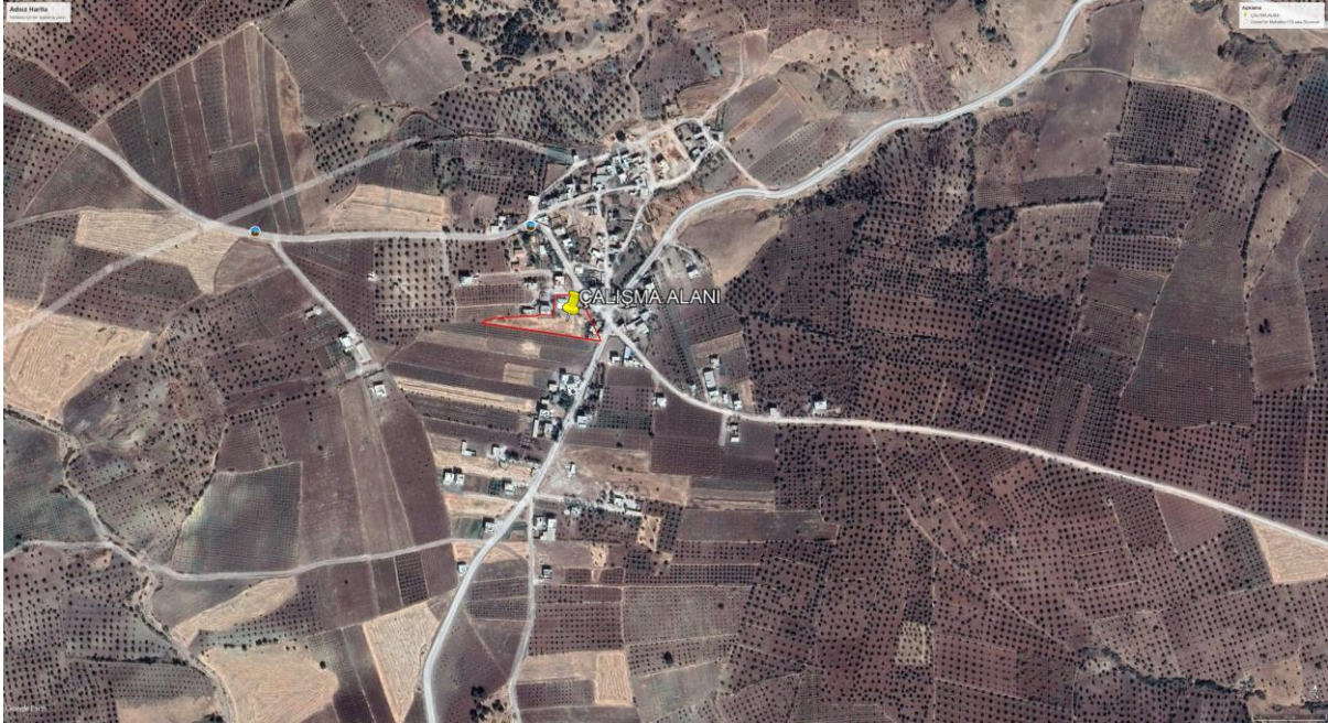
Şekil -1: Uydu Görüntüsü-1

Çalışma Alanı, Kilis ili Musabeyli ilçe Gündeğer Köyü 115 Ada 38 Parsel O38A01D 1/5000 ölçekli Nazım İmar paftasında yer almakta olup, yaklaşık 0,4 hektarlık alanı kaplamaktadır. Alan, Gündeğer köyünde yer almaktadır. Aşağıda alanın konumu ve yapılaşma durumunu gösteren güncel uydu görüntüsü verilmiştir.