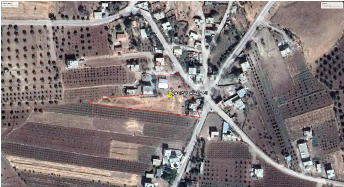
Şekil -2: Uydu Görüntüsü-2

Aşağıda alanın en güncel yapılaşma durumunu gösteren uydu görüntüsü verilmiştir. Uydu görüntüsünden görüldüğü üzere alanın doğu cephesinden yol geçmektedir bu yol planda da kullanılmıştır.