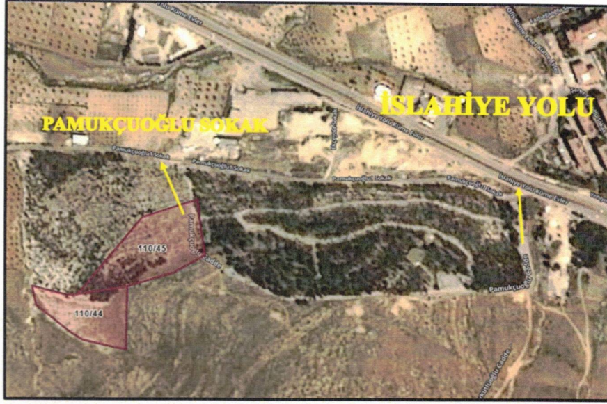
Harita 3: Planlama Alanı Yakın Çevre Ulaşımı

Plana konu olan taşınmazlar kuzeyinde yer alan ve tüm ile hizmet veren İslahiye yolu ile buna bağlantılı Pamukçuoğlu sokaktan hizmet almaktadır. Bu yönüyle İslahiye yolunun yerleşmeler arası bağlantı yolu olması sebebiyle ulaşım açısından güçlü bir yapıya sahiptir. (Harita 3).